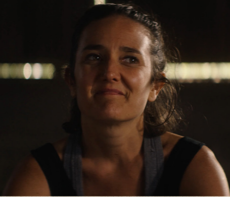
¿SABRINA, UNA MADRE DESPREOCUPADA? ROSINA FRASCHINA