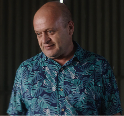
¿RAÚL, UN GURÚ EXTRAVAGANTE? IVÁN MOSCHNER